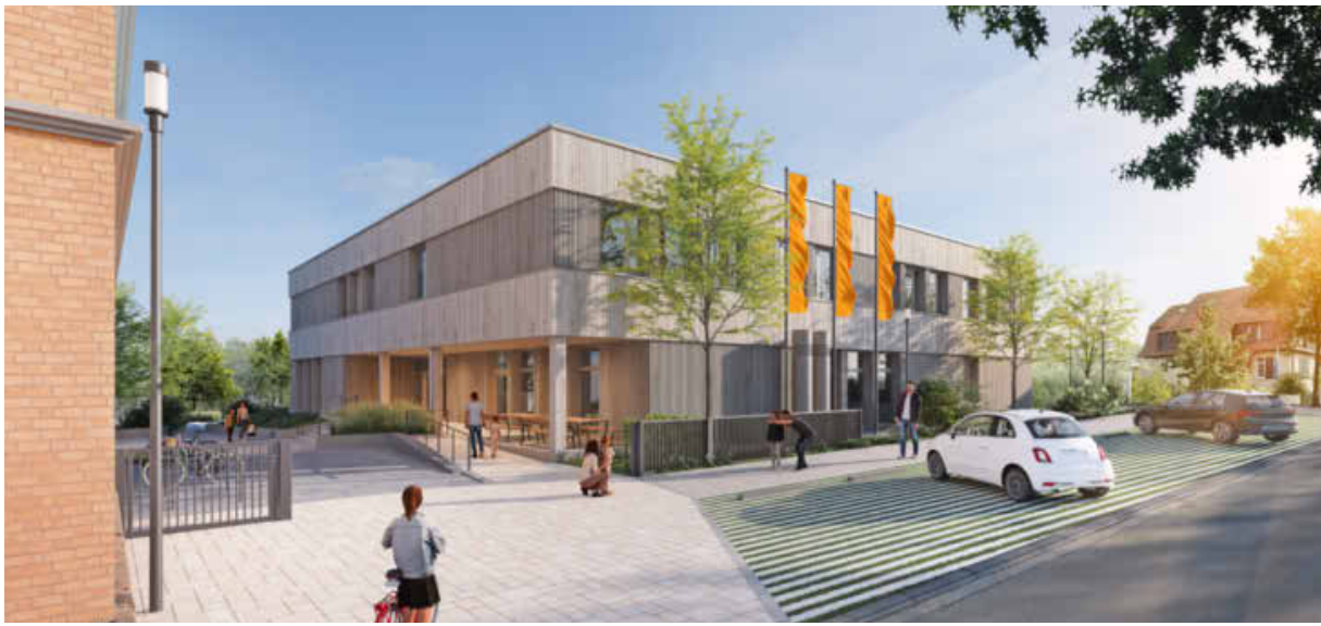
Visualisierung des Erweiterungsbaus der Grundschule Alt-Böckingen.

In seiner jüngsten Sitzung hat der Gemeinderat den Entwurf und die Kostenberechnung in Höhe von 14,7 Millionen Euro für den Schul-erweiterungs- und den Erweiterungsbau einschließlich der Gewerbefläche und der Freianlagen genehmigt sowie seine Zustimmung zur Aufstellung und zum Entwurf des Bebauungsplans erteilt. Der Baubeginn wird für Ende 2024 angestrebt, die Inbetriebnahme der Schule spätestens zum Schuljahr 2026/2027.