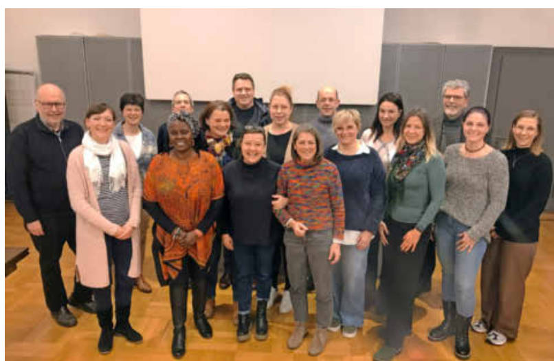
Der neu gegründete Begleitausschuss beschließt zukünftig über die Anträge im Aktiv- und Initiativfonds.

Ab jetzt stehen Infos zur Förderung unter www.heilbronn.de/demokratiapartner zur Verfügung. Die Partnerschaften für Demokratie werden im Rahmen des Bundesprogramms „Demokratie leben!“ vom Bundesministerium für Familie, Senioren, Frauen und Jugend gefördert. (ck)