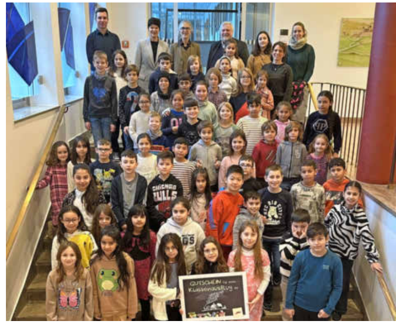
Die diesjährigen Siegerklassen der Aktionswoche „Zu Fuß zur Schule“ wurden im Rathaus ausgezeichnet.

Rahmen der Europäischen Mobilitätswoche statt und richtete den Blick dabei stark auf aktuelle Themen wie Gesundheit, Umwelt und Nachhaltigkeit.