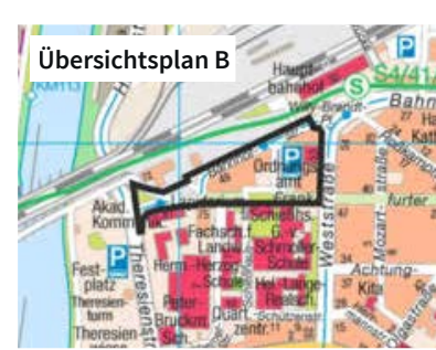
Kartengrundlage: Vermessungs- und Katasteramt