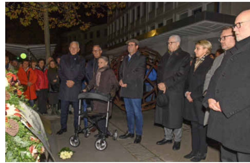
Im Gedenken an die Reichspogromnacht wurden Kränze am Synagogengedenkstein abgelegt.

INFO: Im Podcast „Heilbronner Geschichte(n)“ spricht Stadtarchivdirektor Christhard Schrenk zum jüdischen Leben in Heilbronn. Weitere Informationen unter https://heilbronner-geschichten.blogs.julephosting.de/ .