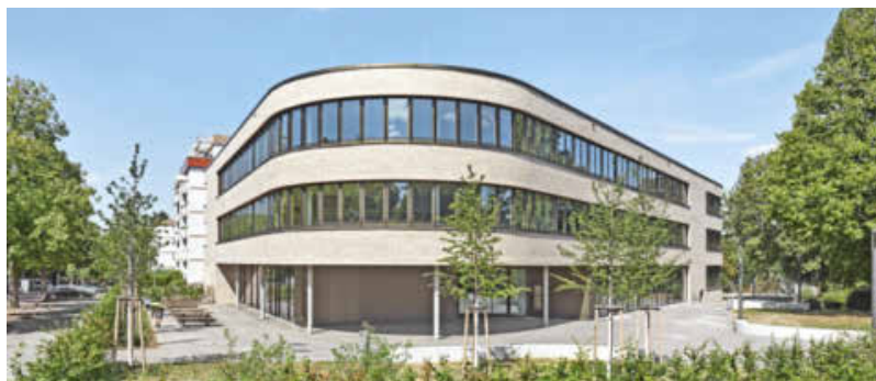
Drei ganz unterschiedliche Bauwerke: Theresienturm, Kindergarten Bernhäusle und Gerhart-Hauptmann-Schule (von oben).

nicht zuletzt maßstäblich bezüglich seiner Einfügung in das Quartier und für seine kleinen Nutzer, lautet das Urteil der Jury. Architekt war hier Joos Keller.