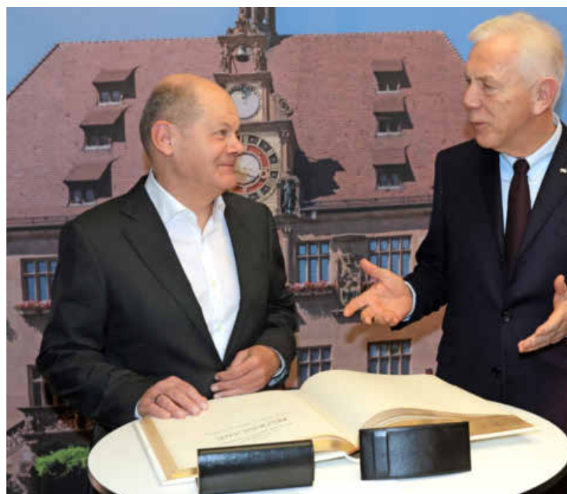
Bei seinem Besuch in Heilbronn trug sich Bundeskanzler Olaf Scholz ins Goldene Buch der Stadt ein.

Bevor es zurück ins Kanzleramt nach Berlin ging, trug sich der Hanseat und langjährige SPD-Politiker mit einer flotten Unterschrift ins Goldene Buch der Stadt Heilbronn ein. Das Buch ist übrigens ein gut gehüteter Schatz im Rathaus und im Tresor verschlossen. (mkk)