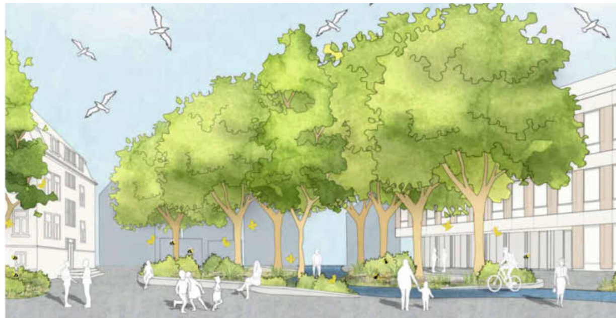
Baubeginn für die neue Neckartalschule soll im Frühjahr 2025 sein. Dann wachsen die Grünwaldschule (links) und die Neckartalschule zu einem Campus zusammen.

Geplant ist ein Abbruch des bestehenden Gebäudes und ein dreigeschossiger Neubau in Holzbauweise. Lediglich für das Untergeschoss, die Treppenhäuser, die Aufzugschächte und