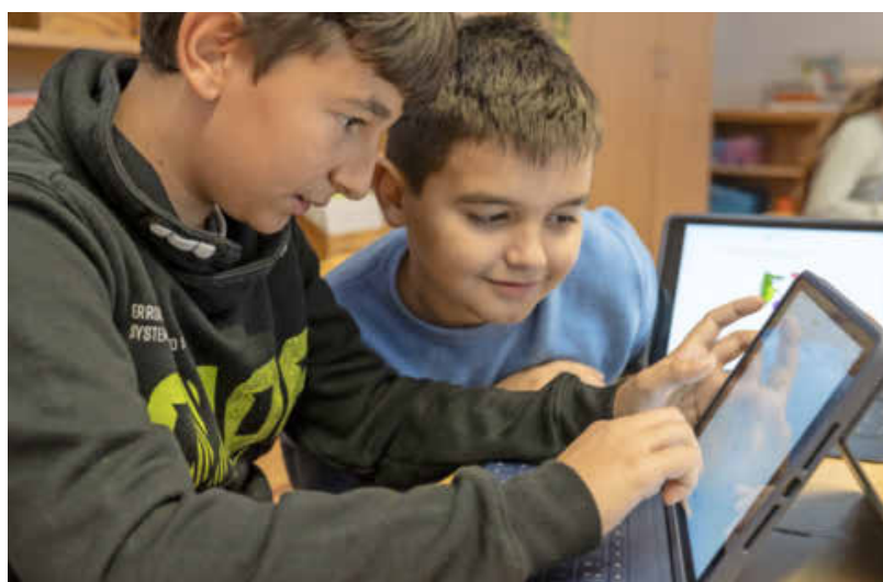
Jedes Kind sowie jede Lehrkraft der Heilbronner Schulen soll zukünftig im Rahmen eines pädagogischen Konzepts kostenfrei ein Tablet bekommen.