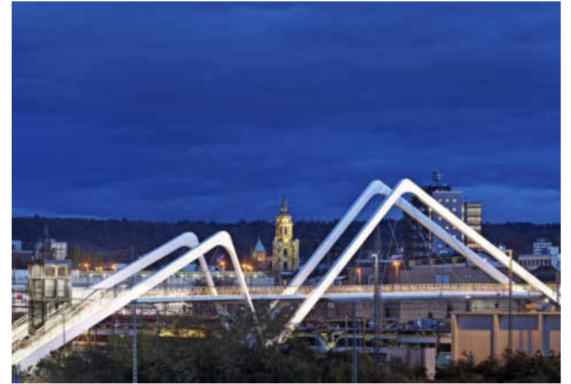
Die BUGA-Brücke fügt sich elegant ins Stadtbild ein. Sie verbindet das Stadtquartier Neckarbogen mit dem Hauptbahnhof und der Bahnhofsvorstadt.