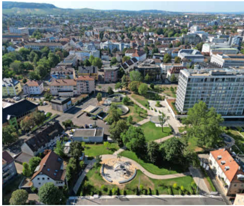
Insbesondere im verdichteten Innenstadtbereich bietet sich ein Wärmenetz an, das mit erneuerbaren Energien gespeist wird.

Bei der Ist-Analyse wird deutlich: Mehr als 89 Prozent der Gebäude in der Stadt Heilbronn sind Wohnhäuser. Industrie-, Gewerbe- und öffentliche Gebäude machen einen deutlich kleineren Anteil aus und spielen bei der Wärmewende deshalb nur eine untergeordnete Rolle. Mehr als drei Viertel der Gebäude wurden vor dem Inkrafttreten der ersten Wärmeschutzverordnung 1977 gebaut. Das spiegelt sich in einer sehr hohen Anzahl von Gebäuden mit niedriger Energieeffizienz wider. Basierend auf Verbrauchswerten wurde ermittelt, dass rund 46 Prozent, also fast