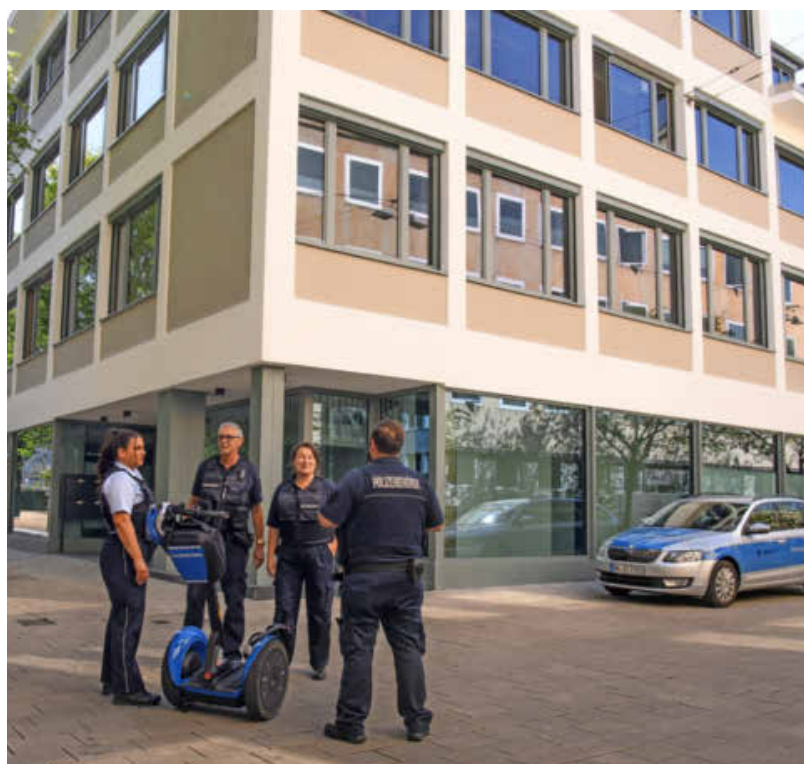
Mit der neuen Dienststelle des Kommunalen Ordnungsdienstes (KOD) in der Lohtorstraße 22 gibt es jetzt eine Anlaufstelle in der Innenstadt.