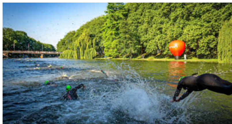
Am Sonntag, 16. Juni, springen die Ausdauerdreikämpfer wieder in den Neckar. Bevor es auf dem Rad und zu Fuß weitergeht.