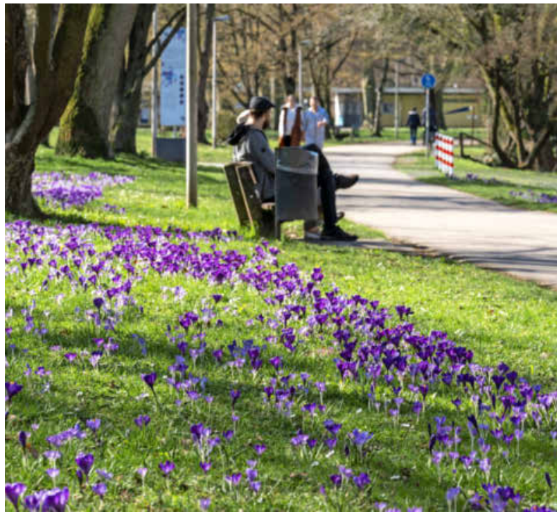
„Frühling lässt sein blaues Band“: Frei nach dem Lyriker Eduard Mörike blühen im März fast 100 000 Krokusse am Neckarufer.

heute den Vorlesungen, heute den Vorlesungen,