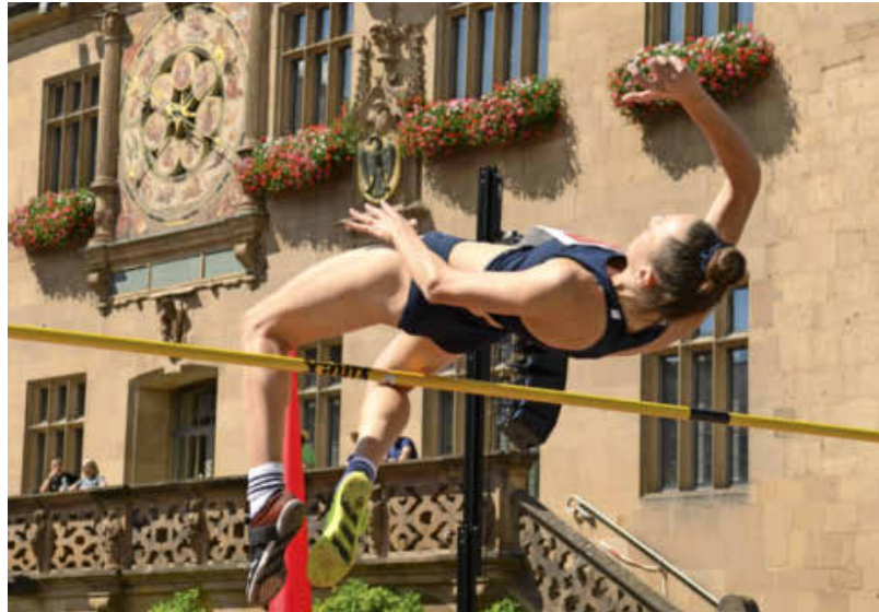
Im August wird der Marktplatz zum Stadion: Zum ersten Mal findet mitten in der Stadt das internationale Hochsprung-Meeting statt.