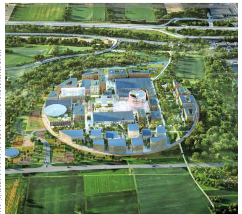
Eine runde Sache: Jetzt ist klar, wie der Innovationspark Künstliche Intelligenz (Ipai) aussehen wird, der im Norden von Heilbronn entsteht.