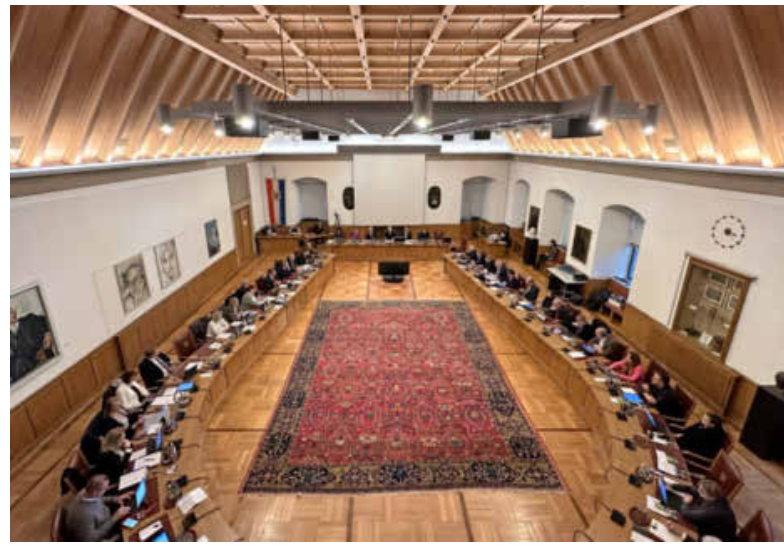
In seiner letzten Sitzung des Jahres 2023 verabschiedete der Gemeinderat Heilbronn den Haushalt 2024 einstimmig.

Erst am Montag hatte der Gemeinderat in einer neunstündigen Sitzung über 300 Finanz- und Deckungsanträge aus den eigenen Reihen beraten und abgestimmt. Insgesamt rechnet die Stadt Heilbronn mit einem positiven ordentlichen Ergebnis von 6,4 Millionen Euro zum Jahresende 2024. Dieses