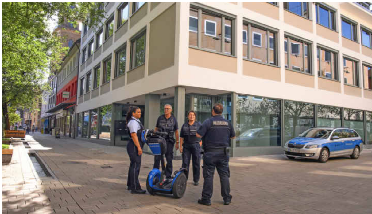
Der Kommunale Ordnungsdienst ist im Bedarfsfall zentral vor Ort.