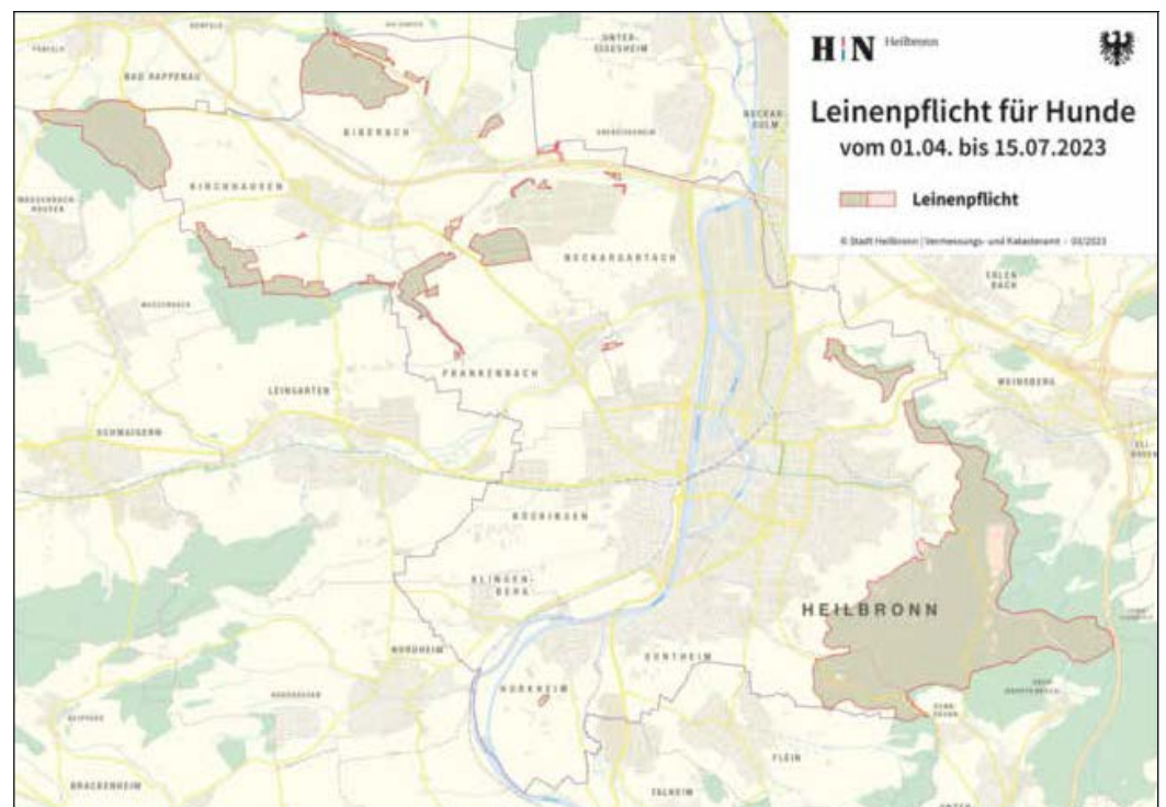
Karte über die von der Leinenpflicht betroffenen Gebiete

Leiter untere Jagdbehörde bei der Stadt Heilbronn