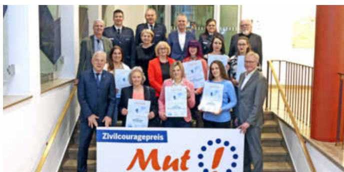
Zivilcouragepreis: Gruppenbild mit Preisträgern.