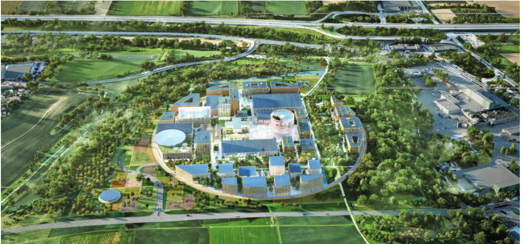
Eine runde Sache: Mit dieser Zukunftsvision des Ipai-Hauptstandortes überzeugte das Architekturbüro MVRDV Jury und Konsortium. Foto: Ipai / Architekturbüro MVRDV