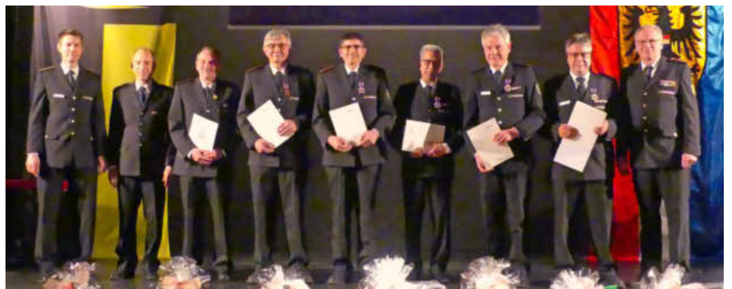
Hauptversammlung: Die neu gewählten Abteilungskommandanten wurden vorgestellt (Foto oben) sowie Mitglieder mit Ehrenkreuzen und Ehrennadeln ausgezeichnet (Bild unten).