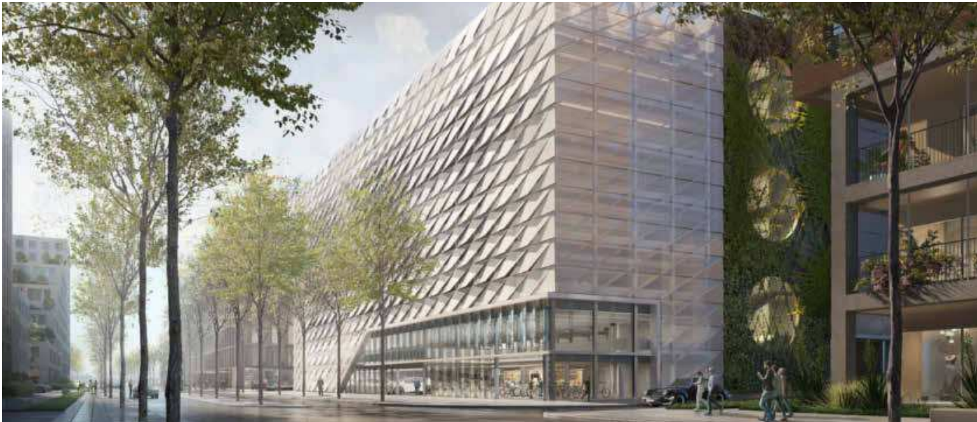
Passend zur Bebauung des Neckarbogens ist der E-Quartiershub individuell gestaltet. Visualisierung: Wittfoht Architekten, Stuttgart