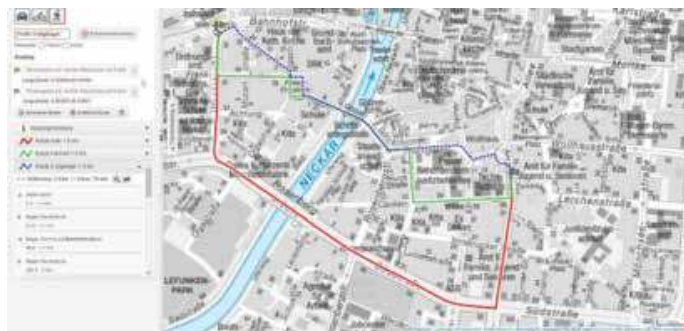
Service für unterwegs: Mit der Routingfunktion wird der schnellste Weg angezeigt.

Auf dem PC kann zusätzlich mit Hilfe des „Erreichbarkeits-Modus“ abgefragt werden, in welcher Zeit oder in welcher Entfernung von einem Ausgangspunkt bestimmte Ziele erreicht werden können. So kann zum Beispiel ermittelt werden, welche Orte vom Hauptbahnhof in fünf, zehn oder 20 Minuten zu Fuß erreichbar sind. Der Nutzer kann darüber hinaus die Hinter-