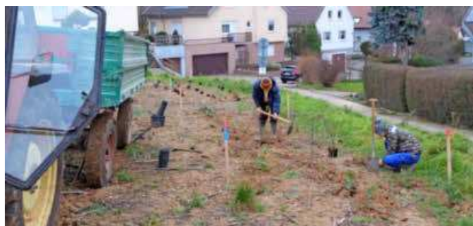
Auch im Gewinn Kehle in Frankenbach sind neue Strauchhecken entstanden.

gleichzeitig dem Schutz vor Bodenerosion und der Speicherung von Oberflächenwasser. Die Gesamtfläche der auf diese Weise neu entstandenen Saumbiotope beträgt mittlerweile etwa 75 Hektar. (red)