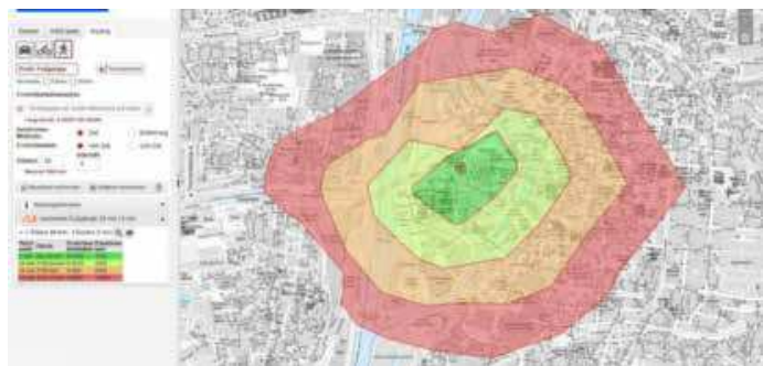
Mit der Erreichbarkeitsanalyse im Online-Stadtplan kann am PC angefragt werden, wann welche Ziele erreicht werden können.

grundkarte frei wählen und so statt des farbigen oder schwarz-weißen Stadtplans auch hochauflösende Luftbilder von 2020 einblenden. Auch europaweite Karten sind hinterlegt.