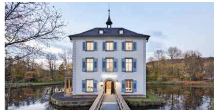
Seit Juli 2020 beheimatet das Trappenseeschlösschen das Literaturhaus Heilbronn.

INFO: Mehr Infos unter www.literaturhaus-heilbronn.de