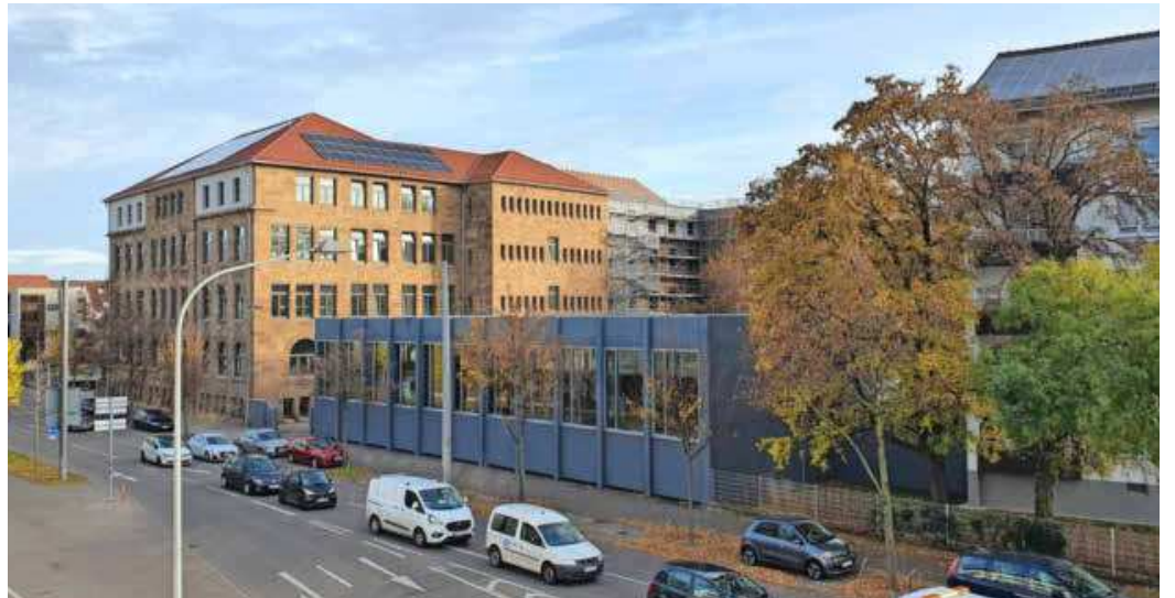
Königlich: Beiden neuen Decken handelt es sich um ein spezielles Leichtbausystem. Dieselben Decken wurden auch im Heidelberger Schloss eingebaut.

Rund 70 Prozent der Heilbronner entscheiden sich für eine Feuerbestattung. (red)