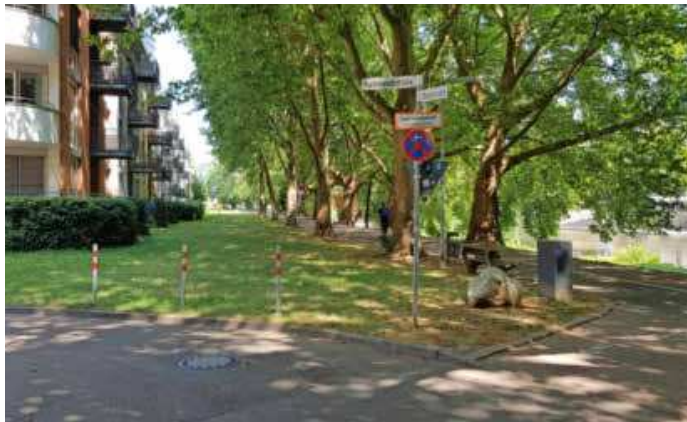
Dieser Wiesenstreifen zwischen Halbmondstraße und Kurt-Schumacher-Platz wird zum Radweg.

Die Umstellung der Straßenbeleuchtung auf umweltfreundliches LED wird weiter fortgeführt. Bis 2025 sollen ein Drittel aller städtischen Lichtpunkte umgestellt sein. (red)