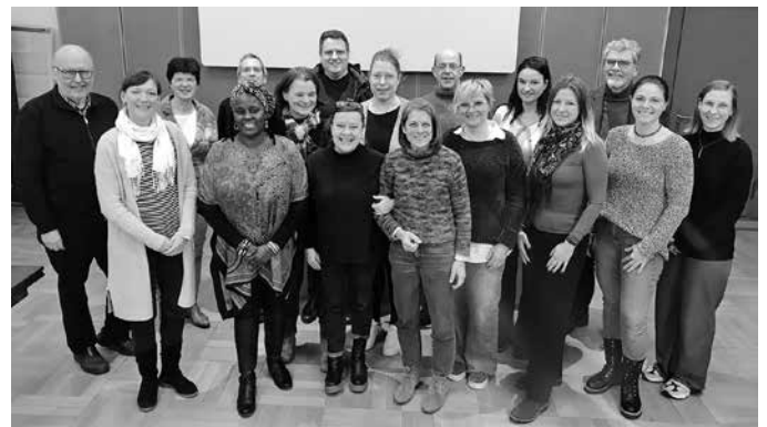
Der neu gegründete Begleitausschuss beschließt zukünftig über die Anträge im Aktiv- und Initiativfonds

Die Partnerschaften für Demokratie werden im Rahmen des Bundesprogramms „Demokratie leben!“ vom Bundesministerium für Familie, Senioren, Frauen und Jugend gefördert.