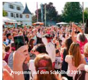
Programm auf dem Schloßhof 2019