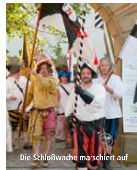
Die Schloßwache marschiert auf