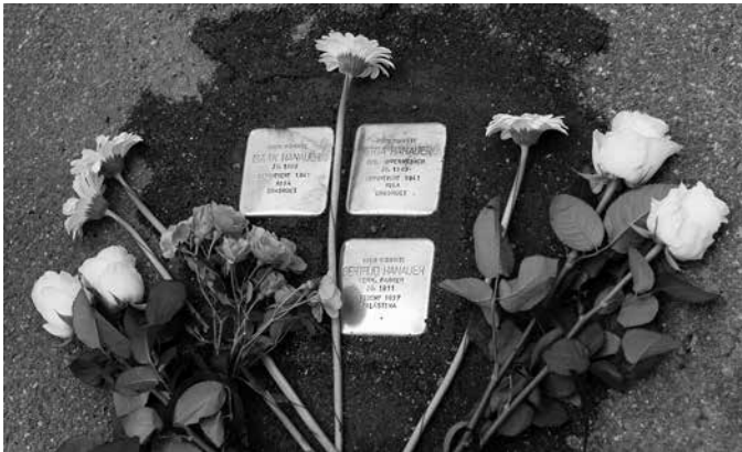
Foto: Stolperstein-Verlegung aus dem Jahr 2019

Weitere Informationen zum Projekt finden sich unter www.stolpersteine-heilbronn.de .