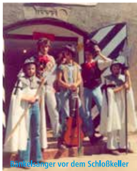
Wirtelsänger vor dem Schloßkeller