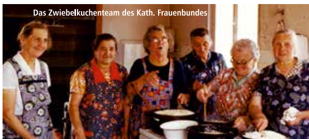
Das Zwiebelkuchenteam des Kath. Frauenbundes