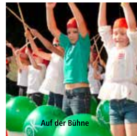
Auf der Bühne