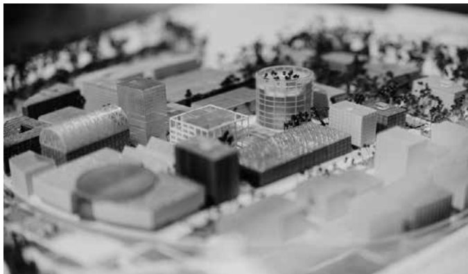
Nahaufnahme vom Modell des Siegerentwurfs, das das niederländische Büro MVRDV vorgelegt hat.