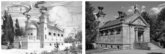
Bilder: Zeichnung: Stadtarchiv Heilbronn D079; Foto: Stadtarchiv Heilbronn/B. Kimmerle

Das im Jahr 1905 auf dem städtischen Hauptfriedhof erbaute Krematorium wird für etwa 1,75 Millionen Euro saniert. Die hierfür notwendigen Arbeiten haben jetzt begonnen. Die Fertigstellung und Wiederinbetriebnahme sind für September vorgesehen.