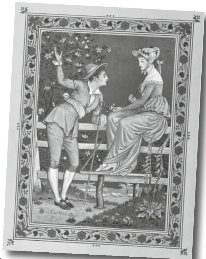
Englische „Valentine“- Grußkarte aus dem Jahr 1876

Nun sind Sie an der Reihe – Gedenken Sie ihrer Liebsten!