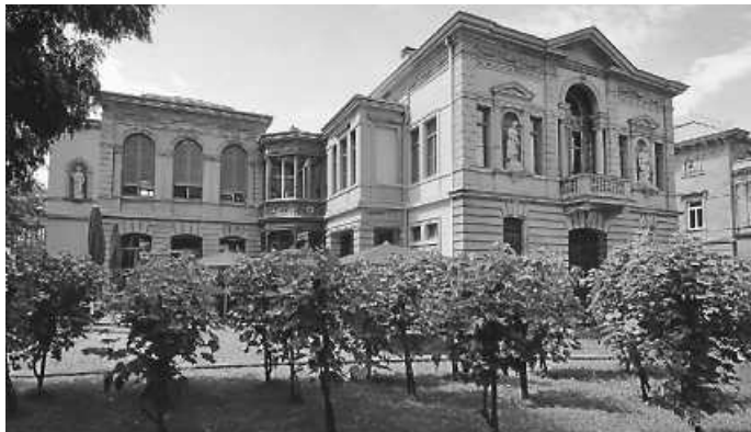
Die ehemalige Villa Faißt steht heute als Wein-Villa Besuchern offen

Seit 2000 wird das Gebäude gemeinschaftlich durch namhafte Weingüter und die Genossenschaftskellerei Heilbronn als Wein-Villa gastronomisch betrieben.