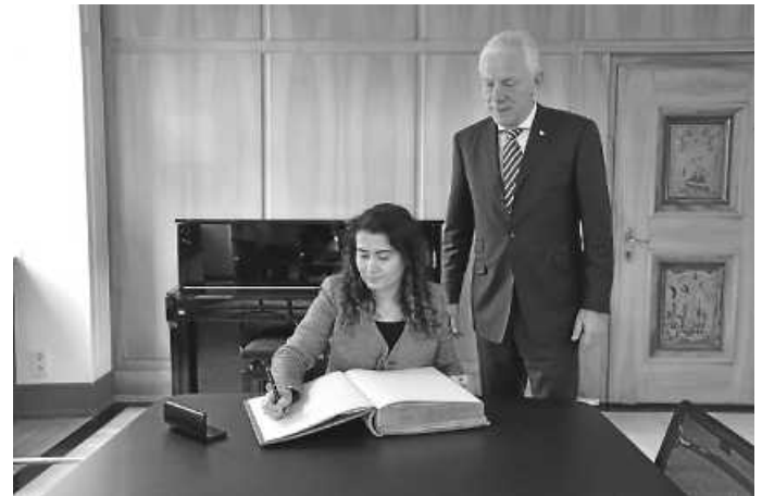
Die türkische Generalkonsulin Makbule Koçak Kaçar in Stuttgart trägt sich im Beisein von Oberbürgermeister Harry Mergel in das Gästebuch der Stadt Heilbronn ein.

Einig waren sich beide darin, dass es ein starkes Europa brauche, um sich auf der weltpolitischen Bühne behaupten zu können. Vor diesem Hintergrund betonten sie die Wichtigkeit einer engen Zusammenarbeit zwischen Deutschland und der Türkei.