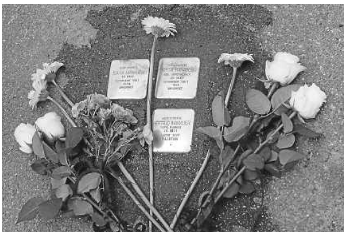
Stolperstein-Verlegung aus dem Jahr 2019, Stadtarchiv Heilbronn/Paula Frank

Zur Erinnerung an die Opfer der nationalsozialistischen Verfolgung werden in der Heilbronner Kernstadt am Donnerstag, 29. Juni 22 neue Stolpersteine verlegt. Die Veranstaltung beginnt um 14.00 Uhr in der Wartbergstraße 50. Alle interessierten Bürgerinnen und Bürger sind zur Teilnahme am Gedenkweg oder zum Gedächtnis an den einzelnen Stationen herzlich eingeladen.