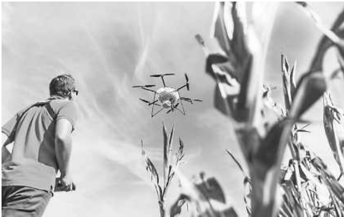
Drohneinsatz im Mais

Gesteuert wird die Drohne von speziell ausgebildeten Piloten, die über einen behördlich anerkannten Flugkundennachweis verfügen. Es sind pro Feld zwei Maßnahmen im Abstand von 10 bis 14 Tagen notwendig.