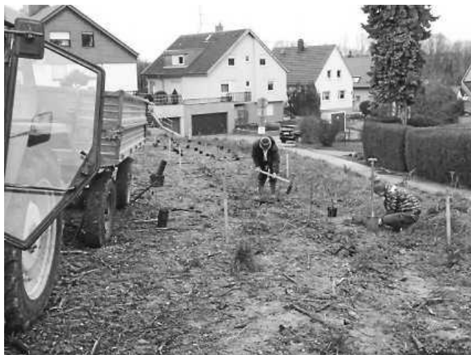
Heckenpflanzung im Gewann Kehle in Frankenbach